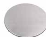
Płyta szczelna 25x10 mm

Dostępne klasy obciążenia: H1,5; K3; L15; R50; M125; N250