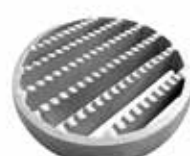
Ruszt drabinowy antypoślizgowy 25x8 mm