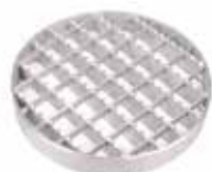
Krata antypoślizgowa 25x3 mm