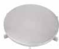
Ruszt płytowy 25x10 mm