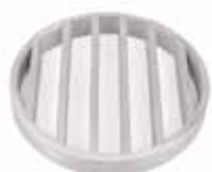
Ruszt drabinowy 25x8 mm